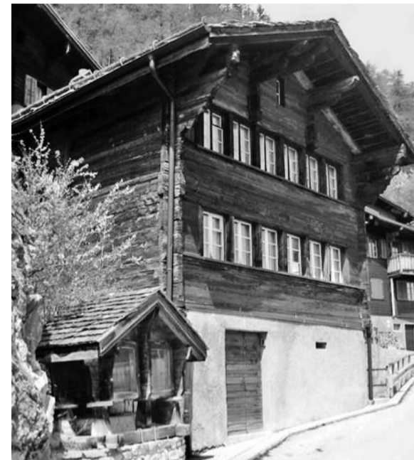
Auszeichnung. Der Raiffeisenpreis 2011 geht an das Pfründhaus in Guttet.

Die Auszeichnung findet im Rahmen der Jahresversammlung des Oberwalliser Heimatschutzes statt. Diese findet diesen Freitag im Gemeindehaus statt und beginnt um 18.45 Uhr. Die einheimische Bevölkerung, Mitglieder und Freunde des Heimatschutzes sowie Gäste sind herzlich willkommen. Im Anschluss an die Veranstaltung offerieren Gemeinde und Heimatschutz einen Apéro mit Imbiss. | wb