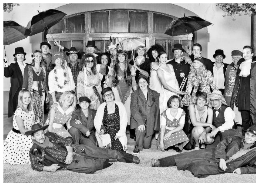
Unterhaltsam. «Andyamo» gibt in Leukerbad drei Konzerte – und alle sind schon ausverkauft.

«Andyamo» – mit einem Durchschnittsalter von 39 Jahren einer der jüngsten Oberwalliser Chöre – begeistert sein Publikum seit seiner Gründung im Oktober 2010. Die Namensgebung «Andyamo» steht für die Schlagwörter «anders, dynamisch, offen» – und diese Wortwahl widerspiegelt sich gleichzeitig auch in der diesjährigen Wahl des Musikstils. | wb